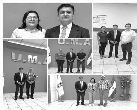
Directores y Docentes de las Instituciones de Educación Media del Instituto Jaime Abdul Gutiérrez, Complejo Educativo Thomas Jefferson, Colegio Salarrue, Colegio San Francisco de Asís y el Instituto Politécnico de Sonsonate.