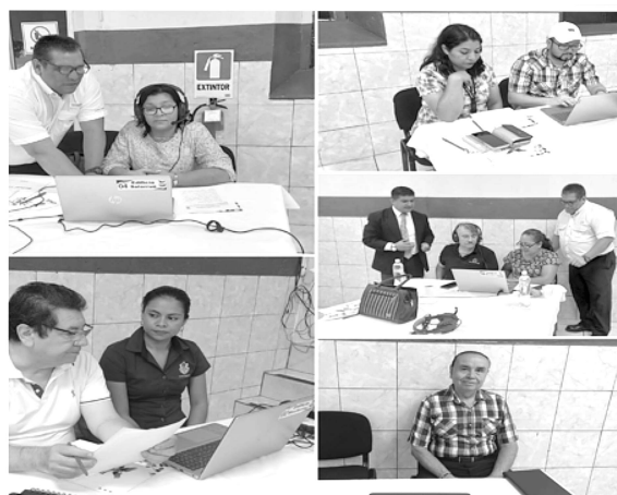
Taller de focus group